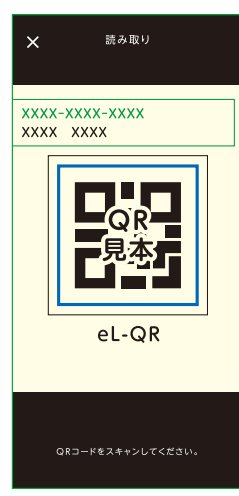
カメラで納付書のQRコードを読み取る