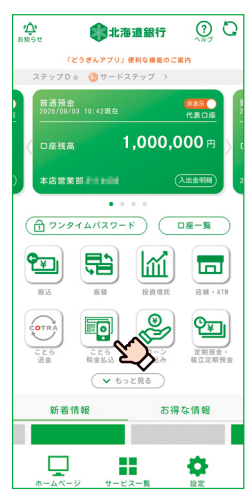
「こたら税金払込」をタップ