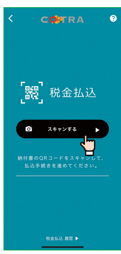
「スキャンする」をタップ