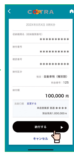
納付内容を確認する