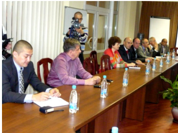
ロシア企業参会者