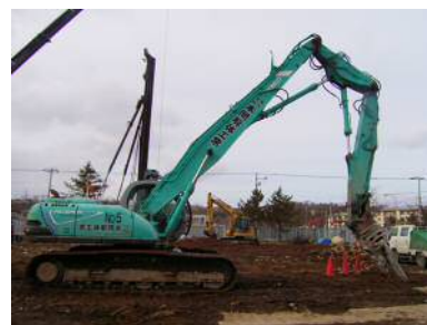
【解体工事現場の様子】