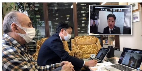
取引先A社 (写真左) と両行行員との打ち合わせ

北陸銀行取引先A社が販売しているワインを北海道ニセコのホテルへ納入出来ないかを検討