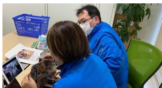
取引先B社 (写真) とC社 (リモート) の商談

両行に取引がある函館市内B社の食品販売に向けて札幌市内の北海道銀行取引先C社と商談