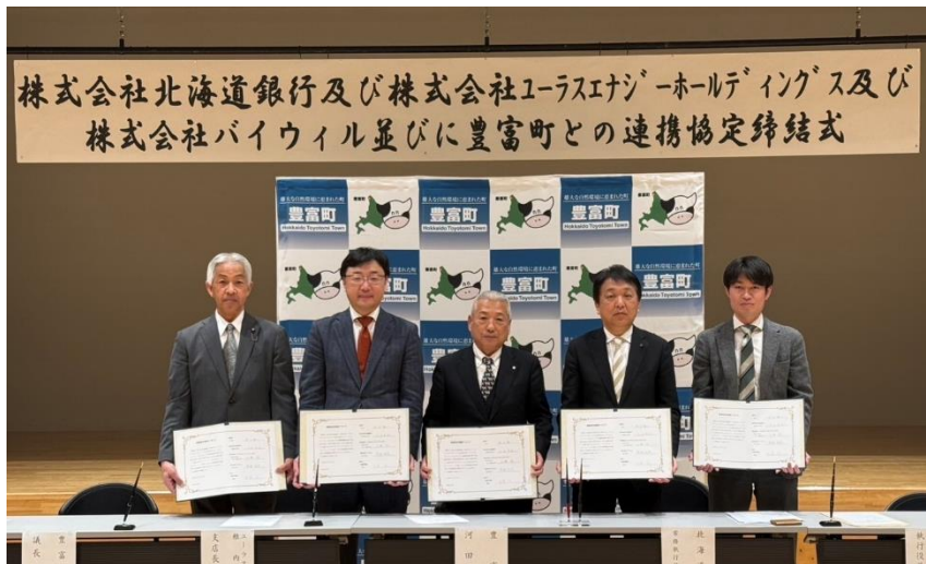
(写真左から千葉議長、加藤支店長、河田町長、大西常務執行役員、齋藤執行役員)