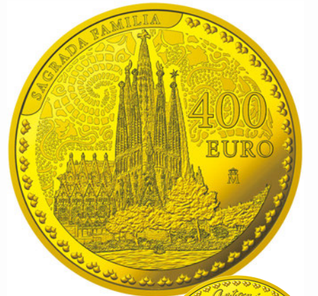
400ユーロ金貨<サグラダ・ファミリア> 裏面/表面

(注1)サグラダ・ファミリア贖罪聖堂建設委員会財団(Junta Constructora del Temple Expiatori de la Sagrada Família)の建築図面に基づき、王立スペイン造幣局がデザイン