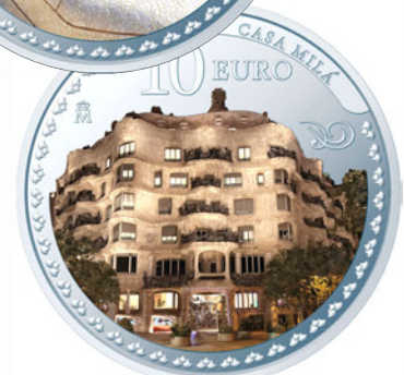
上/10ユーロカラー銀貨<グエル公園>裏面 下/10ユーロカラー銀貨<カサ・ミラ>裏面