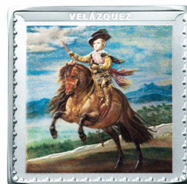
プラド美術館200周年記念コイン