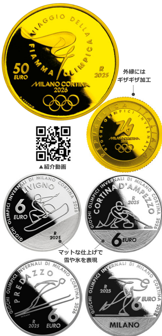
上段：50ユーロ金貨 裏面／50ユーロ金貨 表面 中段：スノーボード銀貨 裏面／カーリング銀貨 裏面 下段：スキージャンプ銀貨 裏面／スピードスケート銀貨 裏面

東京1964大会では、世界で初めて競技種目や公共施設などを誰にでもわかりやすく表したピクトグラムが体系的に作られ、同大会のレガシーの一つとなっています。また東京2020大会では開会式の演出にも使われました。