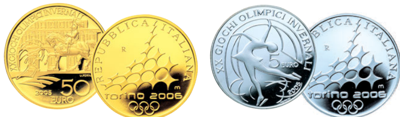
トリノ2006オリンピック冬季競技大会 公式記念コイン