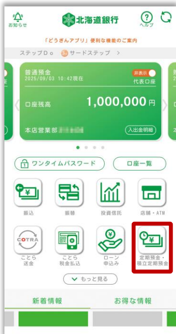
1.「定期預金」をタップ