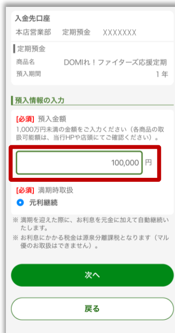
4.預入金額を入力 ※預入金額は10万円以上 1,000万円未満