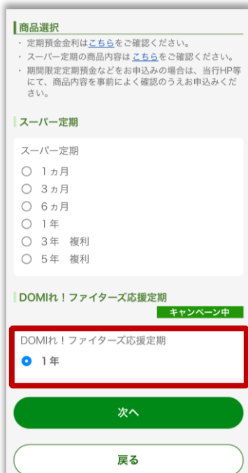
3.商品選択画面で「DOMIれ! ファイターズ応援定期」を選択