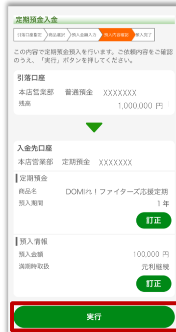
5.内容を確認し「実行」をタップ