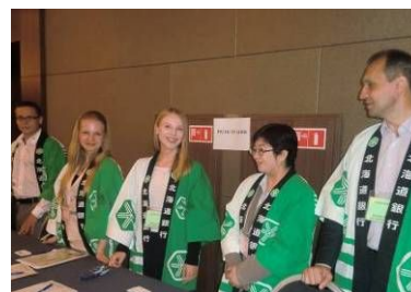
交流会の様子(平成26年6月)

ウラジオストク海外駐在員事務所開設(平成26年3月)を記念し、当行ロシア室は北海道と「道銀ロシア極東ビジネス交流会」を開催しました。本交流会では、相互理解を深めるため、現地のビジネス視察や自社P