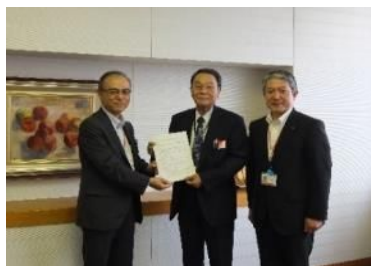
富山県中小企業診断協会との提携 (平成26年9月)

北陸・北海道地区において、各地区の中小企業診断(士)協会との業務提携を行いました。地域事情や該当業種にも理解のある地元の中小企業診断士による、事業計画策定やモニタリングなどのサポート体制を強化しました。