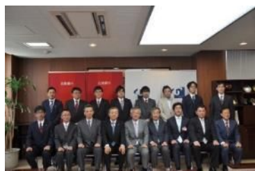
富大ほくぎん若手研究者助成金贈呈式 (平成26年5月)

金沢大学・富山大学において若手研究者に各々500万円を毎年助成しております。将来有望な若手研究者への支援を通じて学術研究発展に寄与する取組みを継続して実施しております。