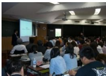
金沢大学での講義の様子 (平成26年5月)

平成26年度上半期は、金沢大学や富山大学において、前期通期で講義を実施し、金沢工業大学・金沢星稜大学・富山県立大学においても1～6コマの講義を実施しました。当行では、将来の地域を担う若い世代への各種教育を通じ、長期的視野での地域貢献に資する取組みを行っております。