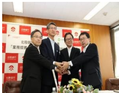
調印時の様子(平成26年8月)

平成26年8月、創業支援、ベンチャー企業支援、農商工連携、経営革新等、中小企業者、農林水産業者の振興に資することを目的に日本政策金融公庫富山支店、金沢支店、福井支店と連携協定を締結しました。互いの強みを活かして連携を図り、協調融資等をはじめとした、地域経済の活性化に資する取組みを進めてまいります。