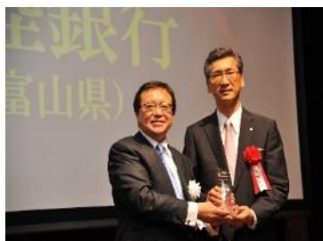
受賞時の様子 (平成26年6月)

中小・中堅企業M & A仲介機関大手の(株)日本M & Aセンターと連携し、富山・高岡・石川・福井の4会場で個社別株価診断会を実施しました。また、多くのM & Aニーズを発掘し、事業承継問題を解決するM & Aを成約したとして同社から表彰を受けました(平成25年度実績)。