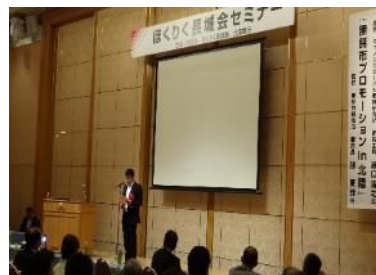
セミナーの様子(平成26年9月)

当行の会員組織である「ほくりく長城会」の会員向けセミナーの講師として、当行が業務提携を結んでいる中国江蘇省無錫市招商局より副局長をお招きし、無錫市の産業や経済を紹介いただきました。