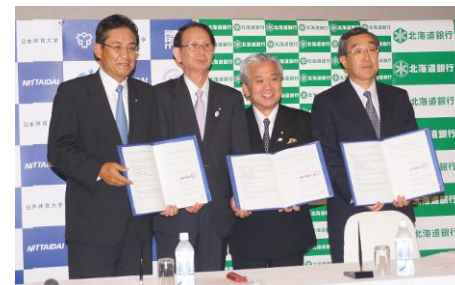
調印式の様子(平成26年8月)

学校法人日本体育大学、株式会社道銀地域総合研究所および北海道銀行の3者で、包括連携協定を締結いたしました。学校法人日本体育大学が網走市で計画する知的障害者特別支援教育の実践の中で、3者の相互協力によって、地域産業にマッチした職業訓練等の調査研究、卒業生の受け皿環境の調査や情報支援、また道内企業や医療機関との連携についての調査・研究・紹介などを行い、相互の発展、社会貢献、地域振興の実現を目指すものです。