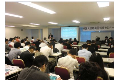
セミナーの様子(平成26年7月)

公益財団法人国際人材育成機構の協力のもと、外部から講師を招き、外国人技能実習制度にかかるセミナーを開催しました。北海道においても建設業を中心に人材不足は深刻な問題であり、東南アジアなどから実習生を受け入れ活用して