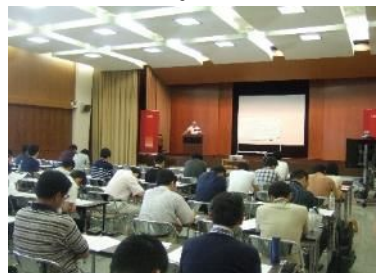
勉強会の様子(平成26年6月)

平成26年度上半期は「不動産」をテーマに、オフィスビル・賃貸住宅・ビジネスホテルの収益還元手法について講義を行い、403名の行員が参加いたしました。