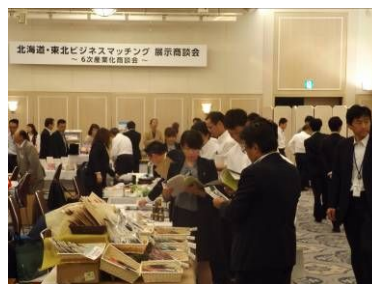
商談会の様子(平成26年6月)

今回は、平成25年11月に開催した「東北・北海道6次産業化ビジネスフォーラム」の参加企業を個別にフォローし、商談成約や新事業展開に向けたバックアップを実施したことが特徴です。