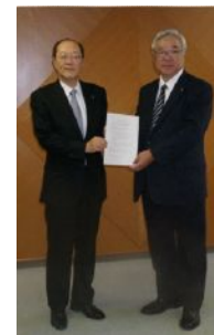
調印時の様子 (平成26年5月)

道内における中小企業の健全な発展を図るため、北海道税理士会と中小企業支援に関する覚書を締結しました。この覚書には北海道税理士会と当行が中小企業支援等に係る業務を通じて、北海道経済の発展に寄与することを目的に、相互に協力し活動することを織り込んでおります。本提携により、お取引先の経営改善、資金調達能力強化に繋がると考えており、これからも地元地域への円滑な資金供給および発展に貢献してまいります。