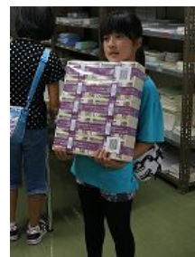
銀行体験の様子 (平成26年8月)

小学生とその保護者の方を対象とした「夏休み親子で銀行体験」を札幌、函館、小樽、室蘭、苫小牧、旭川、釧路、北見、帯広の道内9都市で開催しました。